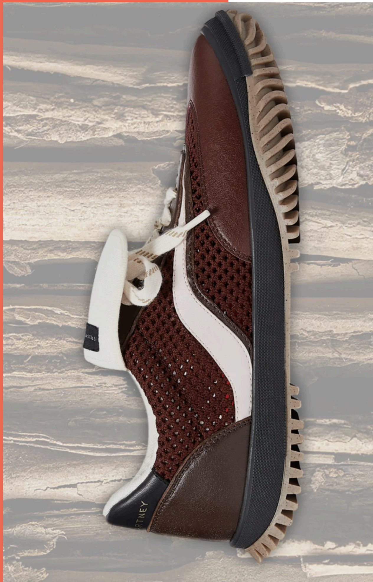
Imagen: Stella McCartney